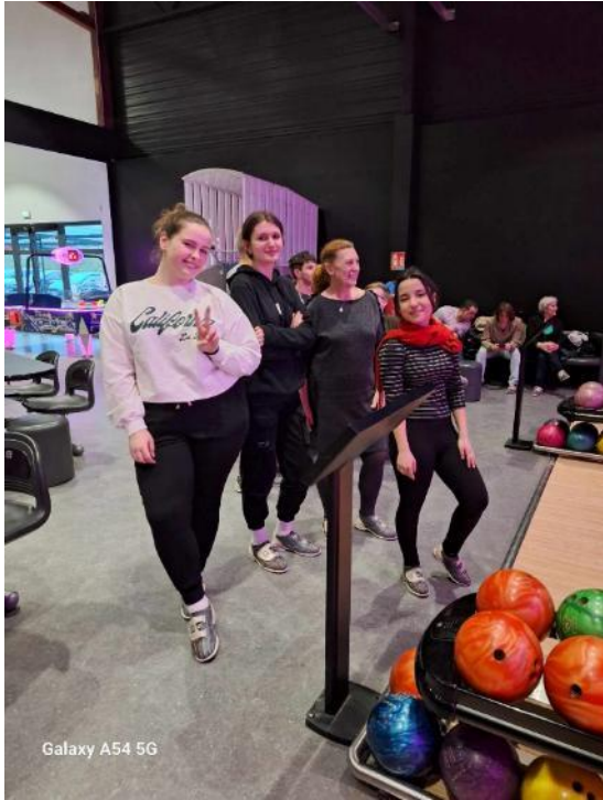
Galaxy A54 5G