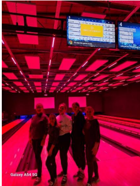
Galaxy A54 5G