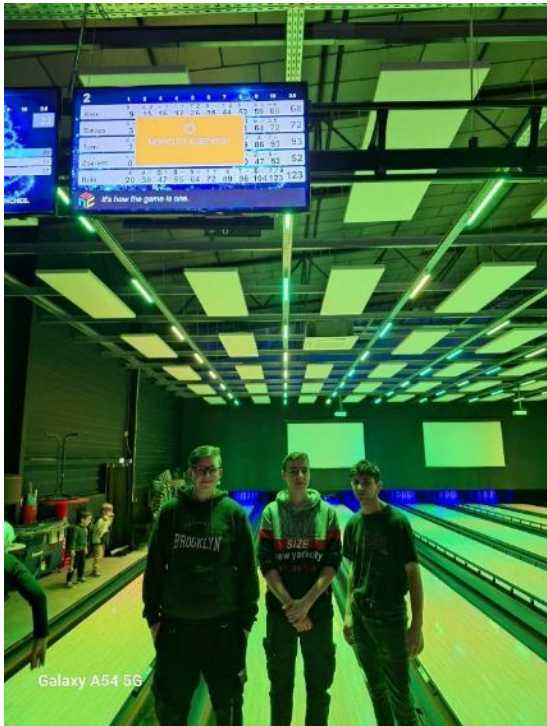
Galaxy A54 5G